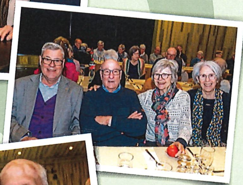
Impressionen der Jahresversammlung der Pensioniertenvereinigung PSSL Thurgau